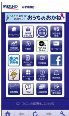
スマートフォン用画面

サービス開始1年弱でダウンロードは20万件を超え、アクセスは500万件を記録。インターネットバンキングでの取引件数増をはじめ、スマートフォンを通じた取引の活性化に貢献している。