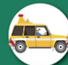
住民苦情に スピーディーな対応