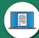
各種報告資料の自動作成 (内業負担の大幅な削減)