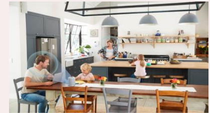
日常会話ができ、音漏れもないウ ェアラブルデバイス・ ポータブルスピーカー