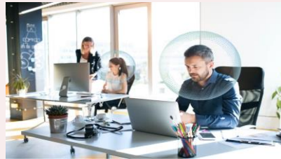
音漏れのないWeb会議 (チェア一体型音響/マイク)