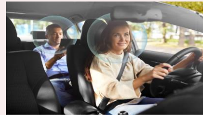
シートごとに異なる コンテンツの再生ができる 自動車シート