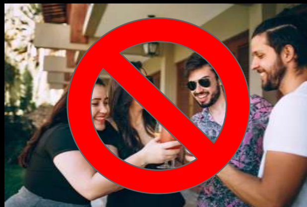
コミュニケーション・出会い