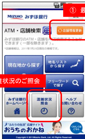
① 最新データの反映