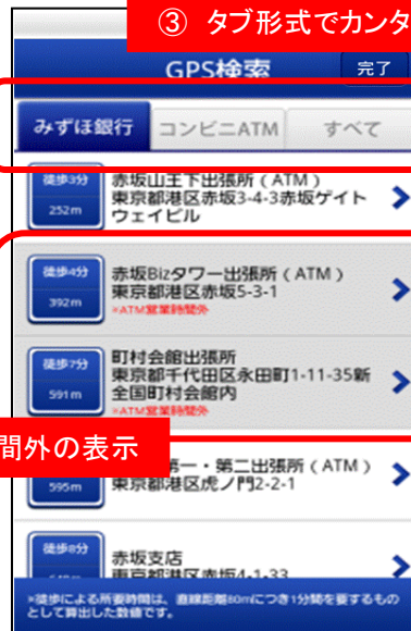
③ タブ形式でカンタン切り替え