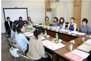
OBの話を聞く座談会