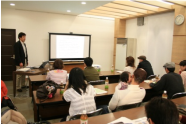
家づくりセミナー開催