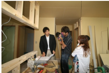
施工中の現場打合せ