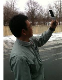
現場で写真を撮影