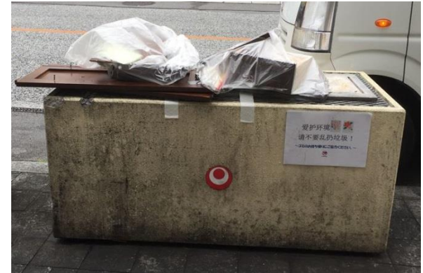
2017年9月6日19時47分時点状況