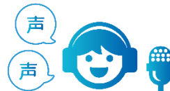
プロフェッショナル (声優、タレント)