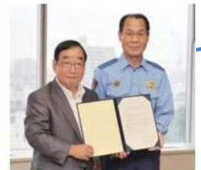
高崎警察署と協定を締結

現在（平成28年11月11日時点）の利用者総数は198件で、これまでの 保護実績は99件にのぼり、 そのほとんどのケースで 30分以内で発見・保護に至っている。